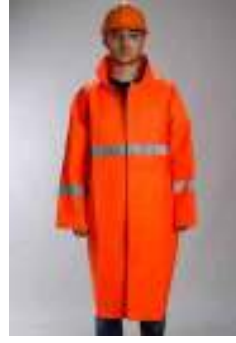
Yangına Dayanıklı Yağmurluk