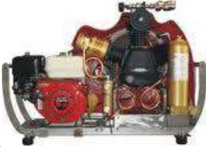
Temiz Hava Dolum Kompresörü