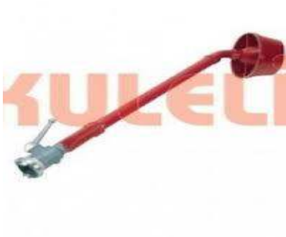
Bükümlü Su sprej Nozul Lans