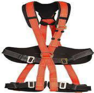
Tam Vücut Dağcı Tipi