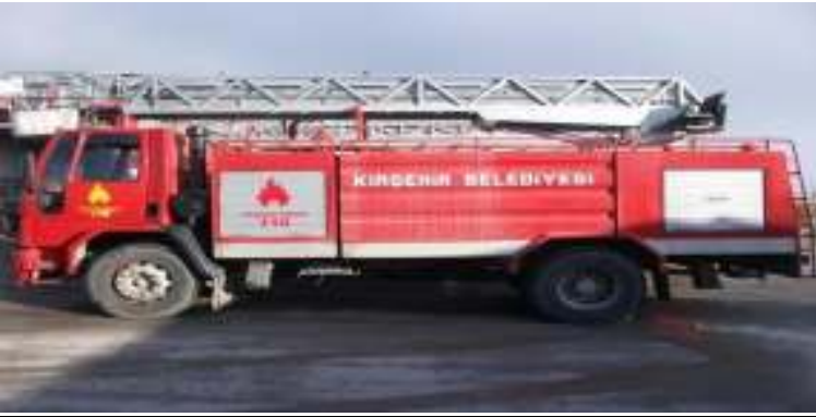
18 Metrelik Hidrolik Merdivenli İtfaiye Aracı