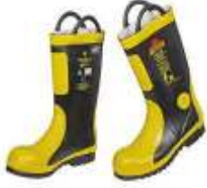
Çelik Burunlu Kauçuk İtfaiye Çizmesi