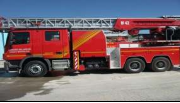
42 Metrelik Hidrolik Merdivenli İtfaiye Aracı