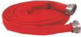
Yangın Su Hortumu