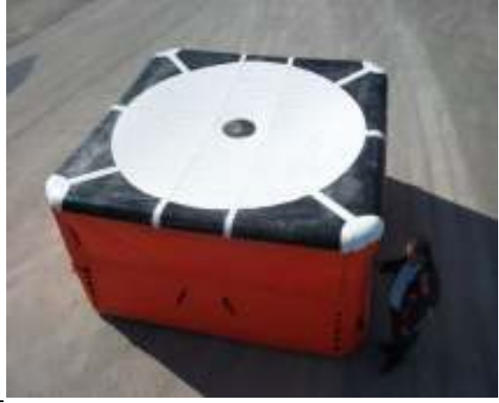
Atlama Döşegi (16 Mt.)