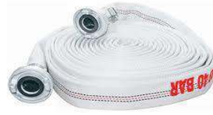
Yangın Su Hortumu