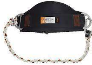
Belden Korumalı Dağcı Tipi