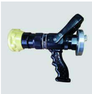
Turbo Nozul Lans