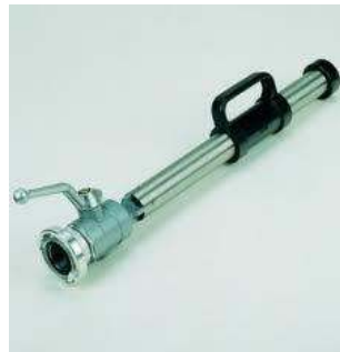
Ağır Tipi Köpük Lansı