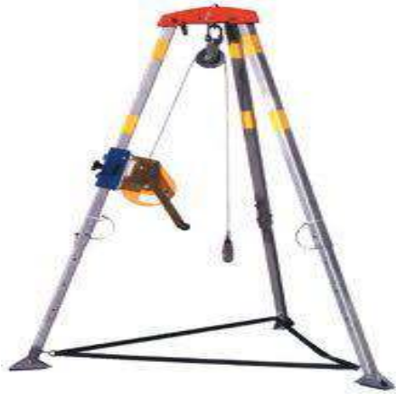
Tripod Kurtarma Seti