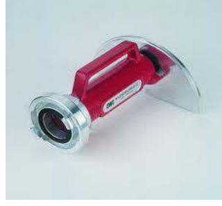
Su Perdesi (Su Kalkanı)