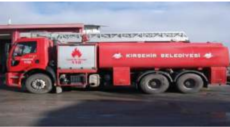
13 Ton Su Kapasiteli Arazöz