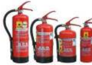
Yangın Söndürme Cihazları