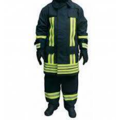
Yangına Yaklaşma Elbisesi