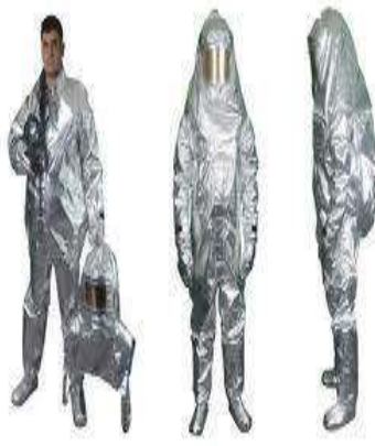
Yanmaz Alüminize Kıyafet