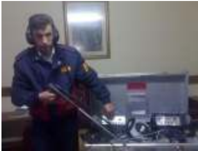
Enkaz Altı Ses Dinleme Cihazı