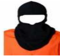
Baş ve Yüz Koruyucu Maske