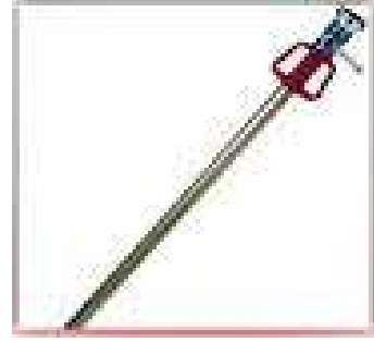
Süngü (Kama) Lans