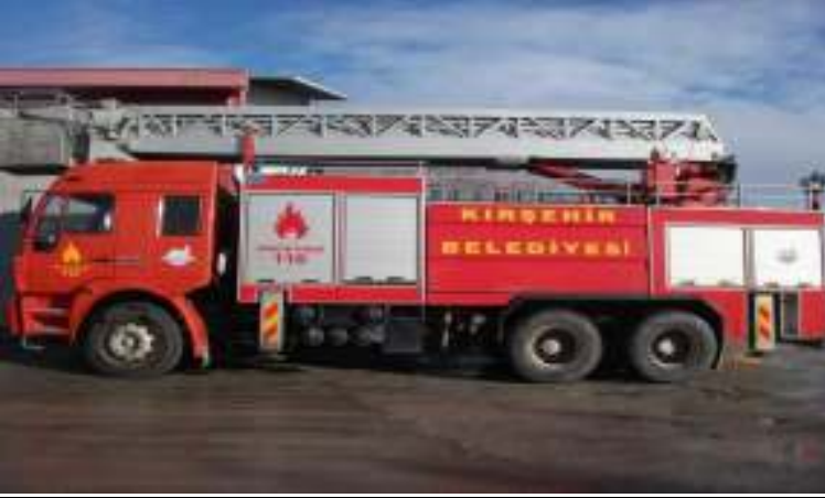
27 Metrelik Hidrolik Merdivenli İtfaiye Aracı