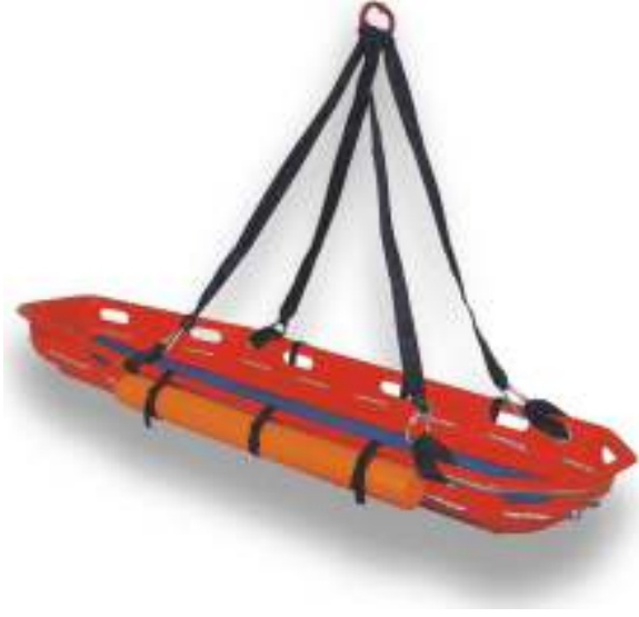
Helikopter Tipi Denizden Kurtarma Sedyesi (Suda 150 Kg. Taşıma Kapasitesi)