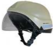
Vizörlü İtfaiye Kaskı