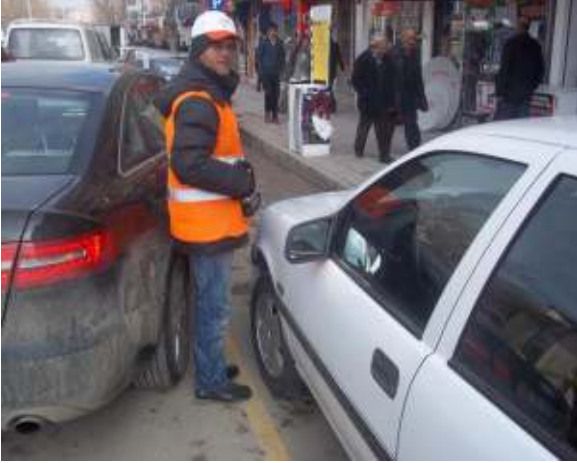
BEĞENDİK KAPALI OTOPARK

21/07/2012 Tarihinde Şehrimizin 3 Caddesinin trafiğın rahatlaması ve Belediyemize ek gelir olan Açık Otoparklar, Müdürlüğümüzün İşletmesine dahil edildiği tarihten itibaren 6 ve 10 arası personel ile başarı işletilmektedir.